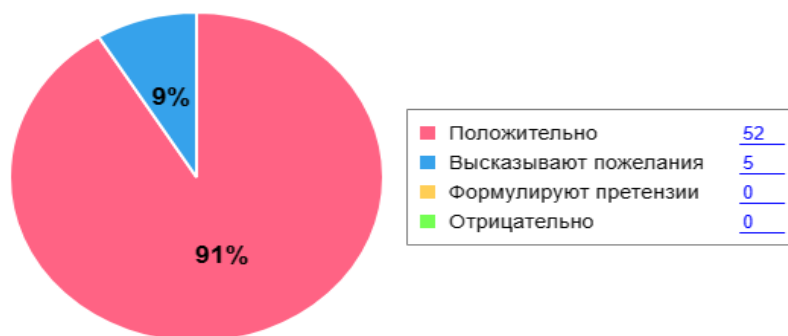
Как родители оценивают детский сад

Родители воспитанников более всего удовлетворены развитием детей в детском саду, уходом и присмотром за ними, уверены в их безопасности в период пребывания в учреждении (1,9 балла). Так же высокая степень удовлетворенности (1,8 – 1,9 балла) наблюдается по следующим аспектам: детям нравится посещать детский сад, родителей воспитанников устраивает управление детским садом и материально-техническое обеспечение учреждения; в детском саду учитывают интересы и точку зрения воспитанников; сотрудники детского сада стараются выяснить точку зрения родителей на различные аспекты деятельности сада.