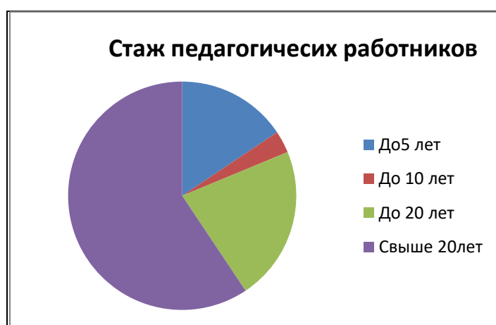
Диаграмма с характеристиками кадрового состава Детского сада